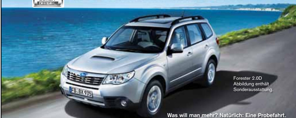
Forester 2.0D Abbildung enthält Sonderausstattung.

Was will man mehr? Natürlich: Eine Probefahrt.